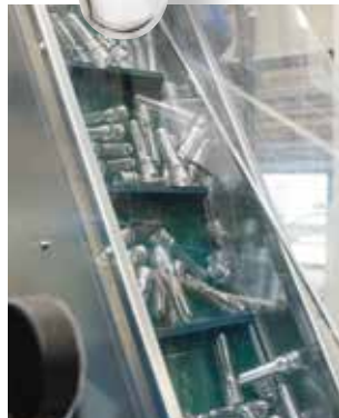
1 PET-Rohlinge (Preforms) 2 Zuführen der Rohlinge 3 Werkzeug 4 4-fach-Produktionsanlage SIPA 5 Ausgabe der PET-Flaschen